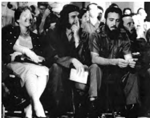
Le Che entouré d'Aleida March, sa femme, et de Fidel Castro lors d'une conférence de presse à La Havane.

C'était oublier les durs coups subis par les populations dans cer-