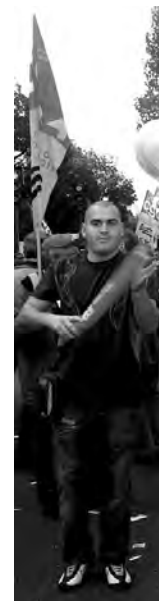
Le 18 octobre à Paris, cortège CGT.

1. Titre de son éditorial dans la revue Challenge , 4 octobre 2007.