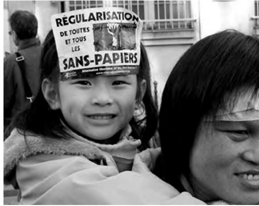
18 septembre à Paris, ouverture de la session parlementaire au sujet de la loi Hortefeux.

Dans un choquant exercice raciste de « deux poids, deux mesures », l'extension de ce concept à la