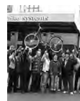
L'équipe du « Strike Bike » dans la cour de l'usine

Le parti d'extrême droite NPD a également tenté d'apporter son soutien, qui a été publiquement