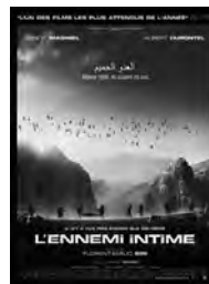
• L'Ennemi intime réalisé par Florent Emilio Siri avec Benoît Magimel, Albert Dupontel, Aurélien Recoing. Durée : 1h 48