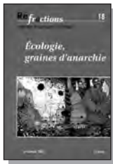
• « Écologie, graines d'anarchie », Réfractons n°18, 12 euros

Plusieurs articles retiennent l'attention. Les différentes pratiques de l'archéologie et les alternatives qui lui sont liées sont décrites, expliquées, critiquées. Une membre du réseau de collectivités de Longo Maï nous décrit les principes, l'historique et le fonctionnement de ce mouvement international né en 1973 – sans romantisme déplacé et sans taire les difficultés et points négatifs de l'expérience. Un article aborde la problématique des transports, qui a pris une ampleur jamais atteinte sur la planète avec la mondialisation. L'auteur fait un état des lieux tout en avançant différentes pistes et solutions envisageables. Puis c'est la question du capitalisme vert qui est traitée, car oui le capitalisme (enfin une certaine partie de ses fans !) commence à prendre en compte l'environnement... mais pour en faire une nou-