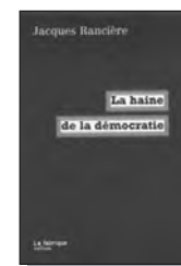
• Jacques Rancière, La Haine de la démocratie , La Fabrique, 2005, 106 pages

La démocratie pour Rancière n'est jamais quelque chose de réalisé. Elle ne