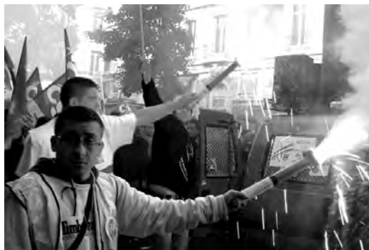
Le 18 octobre, 300 000 personnes ont défilé dans toute la France.

Après l'annonce par Sarkozy de son « nouveau contrat social » en septembre, les organisations syndicales ont rapidement convergé pour appeler à la grève le 18 octobre. Cette journée était d'abord centrée sur la défense des régimes spéciaux, mais la CGT, FO et Solidaires ont senti l'enjeu qu'il y avait