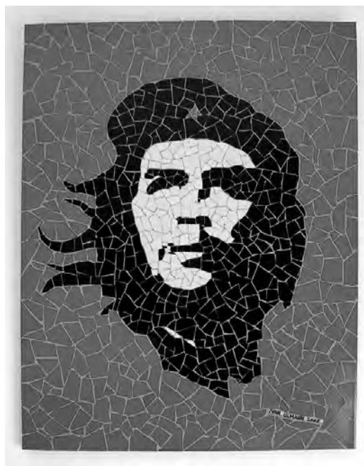
Che Guevara, mosaïque de Ivan Ullmann, 2006.

L'embryon de guérilla du Che, autoproclamée « Armée de libération nationale de Bolivie » (ELNB) fait abstraction des luttes paysan-