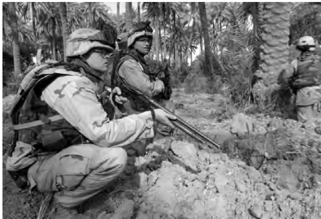
Soldats américains en embuscade près de Bagdad en juin 2004.

L'assaut américain sur Fallouja était un crime de guerre aux proportions historiques. Les civils étaient encouragés à quitter la ville avant l'attaque mais on empêchait les hommes âgés de 15 à 55 ans de partir et ils étaient refoulés aux barrages routiers. À partir de la nuit du 5 novembre 2004, une grande partie de la ville a été pilonnée, malgré la présence, selon une estimation de l'ONU, de 50 000 civils. Notamment des malades, des personnes âgées et des soignants. L'une des premières cibles a été le service des urgences de l'hôpital Nazzal, qui a été rasé par les bombardements dès le matin du premier jour, tuant les médecins, le personnel et les patients. La ville fut déclarée Weapon free : toute per-