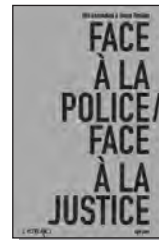
• Elie Escondida et Dante Timélos, Face à la police / Face à la justice , Editions l'Atiplano, février 2007, 158 pages, 7,50 euros.

L'hystérie sécuritaire des gouvernements successifs conduit à un durcissement continu des lois, une régression constante des libertés individuelles et collectives et une véritable diarrhée législative. Devant l'avalanche de nouveaux textes, les militants et militantes ont bien du mal à connaître réellement leurs droits lorsqu'ils et elles sont confronté-e-s à la répression policière et