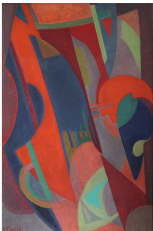
Denise Ferrier, Composition N°2 , Années 1950. 50 x 75 cm. Huile sur isorel.