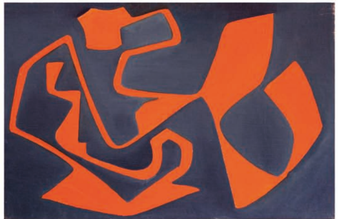
Denise Ferrier, Sans titre , 1972. 41 x 27 cm. Huile sur carton entoilé.