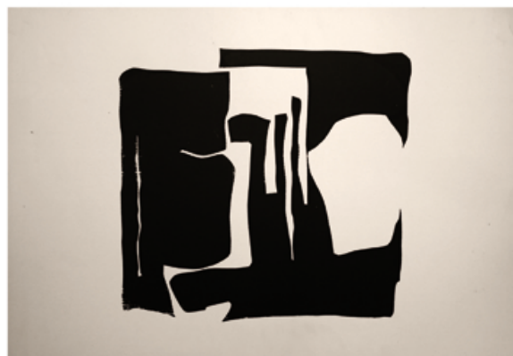
Denise Ferrier, Sans titre , 1990. 65 x 50 cm. Encre sur papier.