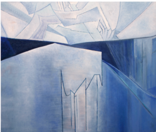
Denise Ferrier, Sans titre , 1989. 50 x 46 cm. Huile sur carton entoilé.

Extrait du catalogue Denise Ferrier / dessin peinture Cité des Fleurs , Ed. Thélème, Paris, octobre 2010.