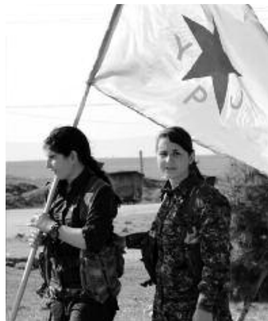
Notre solidarité va aux forces qui, à leur lutte contre le colonialisme, associent un projet émancipateur. Ici, des miliciennes kurdes des YPJ, en Syrie, en 2012.

Un soutien critique aux luttes de libération anticoloniale