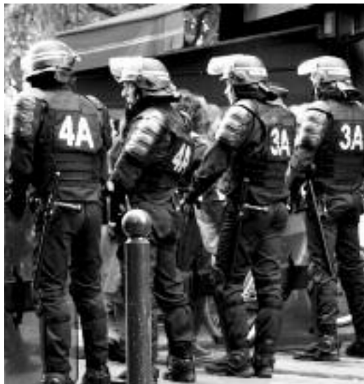
L'État est l'arme principale dont disposent les classes dominantes pour asseoir leur pouvoir, aussi bien par la force que par l'idéologie.

L'anti-étatisme libertaire se distingue également nettement de