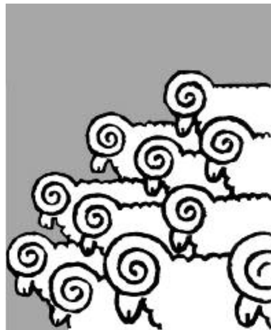
Il faut remettre en cause les normes genrées, sociales, hiérarchiques imposées tout au long de la vie au nom d'une prétendue « nature ».

La société capitaliste est une société éminemment validiste. Le validisme est une oppression qui touche les personnes en situation de handicap (physique ou psychique, visible ou invisible). Le capitalisme encourage et soutient des structures validistes, dans la mesure où il valide les individus en fonction des capacités qui les rendent productifs ou exploitables dans la sphère du salariat. Les personnes qui ne correspondent pas à ces normes sont proprement invalidées, et ainsi exclues, marginalisées ou minorisées. Le validisme est également cristallisé dans les infrastructures urbaines, qui ne sont, le plus souvent, adaptées qu'à un individu valide type (un individu qui n'est pas en fauteuil, par